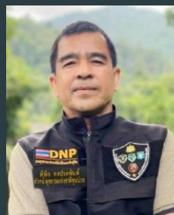
นายพินิจ คงประพันธ์ หัวหน้าอุทยานแห่งชาติขุนน่าน